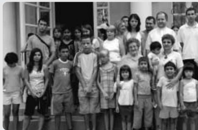
Együtt a táborozók a kastélyparkban