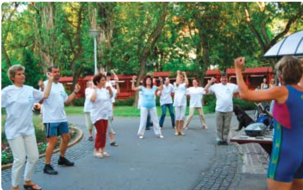
Nap, mint nap élte meg a Napsugár Szabadidő Egyesület főtéri standja és a sakk-park. Az aktivisták rendszeresen szerveznek szabadtéri tornákat is.