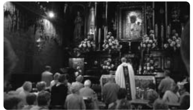
A Fekete Madonnához évente négy millióan zárandokolnak

- Nagyon sok magyarral is találkozunk itt... - Érdekes dolog ez. Ide jönnek messze földről, és itt keresik a segítséget az élet elviseléséhez. Ahhoz, hogy ki-k további tudja vinni a maga keresztjét. Híres, a világban rangosan jegyzett kegyhely ez. Mert különösen is erősen működik a Szűzanya közbenjárása. Vannak, akik csak épületeket, kerteket, emlékeket, történelmet keresnek itt. Persze ezek is megtalálhatók itt, büszkék is lehetnének rájuk, de ez számunkra valójában lényegtelen. Ha művészetet keres valaki, menjen inkább Krakkóba. Czestochowába imádkozni jön a lélek. Töltekezni, kitérülkedni, följajlani. Majdnem egész nap tele van a kegykápolna emberekkel. Reggel 6-kor kezdődik az első mise, de addigra már tele van a kápolna, és ez így történik minden áldott nap, este 9 óráig. Ez számunkra, pálosok számára is csodálatos.