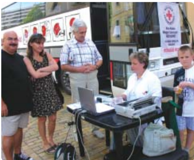
A Vöröskereszt és a Porta Egyesület idén ismét megszervezi a Nagytemplom oldalán a buszos véradást augusztus 19-én és 20-án. Minden érdeklődőt és pártolót szeretettel várunk.