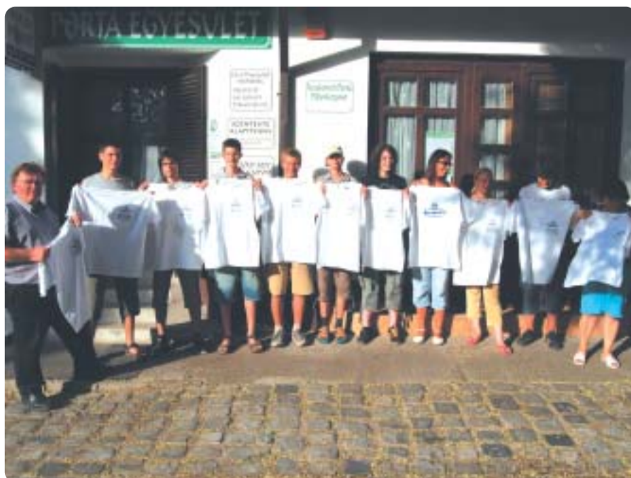
A Végh Mihály téri Porta irodától indultak az angliai cserkész világtalálkozóra a kecskeméti fiatalok