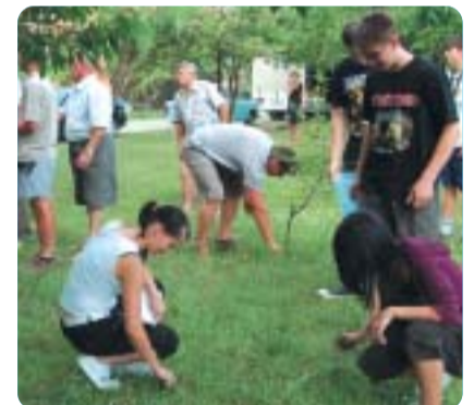
Sikeres parlagfűrtő akciót szervez a város és a Porta Egyesület. Az idén már látványosabb az eredménye.