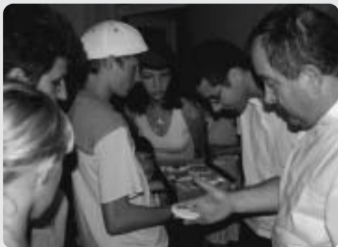
Saját készítésű ajándék az érsek atyának