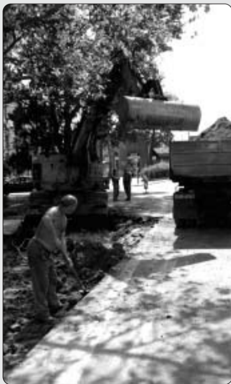
Munka közben a kecskeméti Kiskőrúton

hamarosan már nem szennyezi a talajt, hanem a szennyvizet csatornán elvezetve, korszerű tisztítóművön megtisztítva juttatja vissza a vizet a természetbe. Hogy a csatornára rákötthessenek azok a városlakók is, akik nem tudják egy összegben kifizetni a csatlakozás költségét, azoknak segít Kecskemét. A lakossági önerős közműépítési