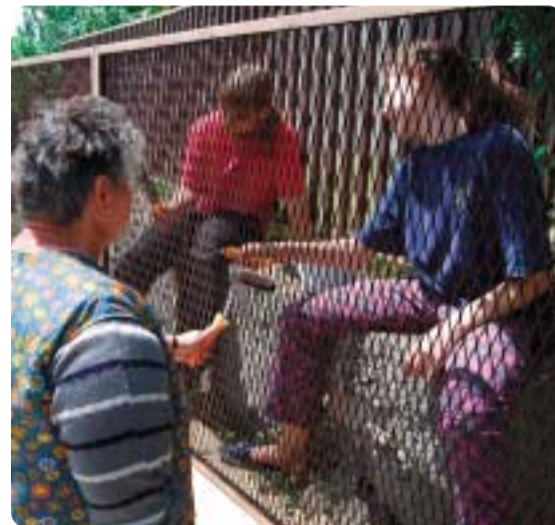
Megszépült a kunbaracsi katolikus templom kerítése, hamarosan megkezdik a harangtorony építését is.