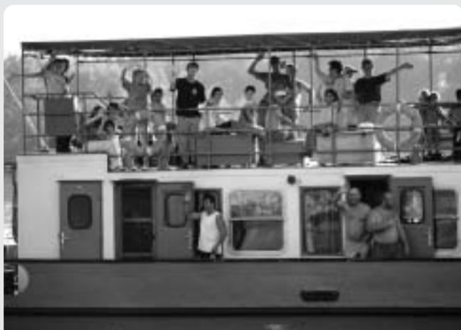
Hajókirándulás a Dunán

Felejthetetlen, élménydús nap volt, sok strandolással, játékkal, kirándulásokkal.