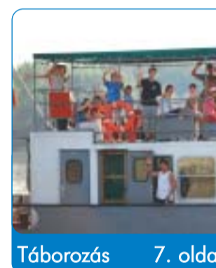
Táborozás 7. oldal