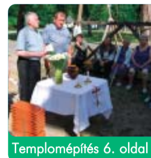
Templomépítés 6. oldal

Példamutató rendőrök – Hagyomány a Bács-Kiskun megyei rendőröknél, hogy szabadidejükben közösség építő „gyakorlatot” szerveznek. Az idei nyáron immár második alkalommal a Kecskemét határában lévő Csalánosi Parkerdőt tisztították meg a főkapitány illetve a kapitányok aktív részvételével, A rendezvény társszervezője a Sasfészek Vendéglő és a Porta Egyesület volt.