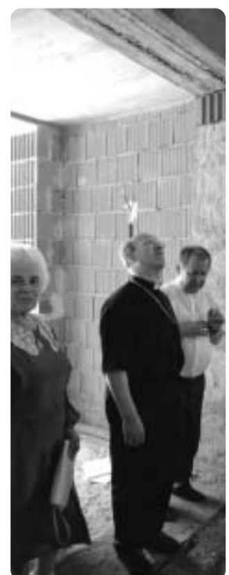
Szemle az építkezésen