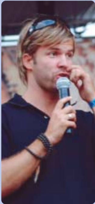
Sebestyén Balázs, a közismert tévés sztár volt a műsorvezető.