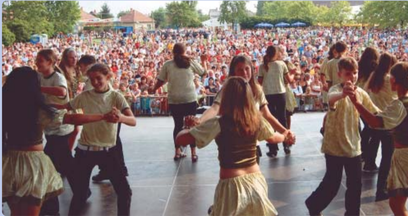
A színvonalas ünnepi rendezvénysorozatra ezerszámra érkezett érdeklődő az ország különböző részeiről is.