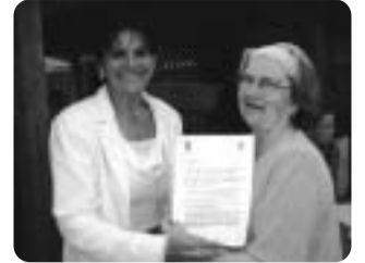
Az örök barátság jegyében.

Erdélyországba indulni minden utazónak felér a csodavárás bizsergő izgalmával. Ilyen érzések kerfették hatalmukba a múlt héten Gyergyószentmiklóstra induló 20 tagú kecskeméti delegáció tagjait, akik viszontlátogatásra indultak a kék hegyek birodalmába. Az elmúlt évi Csiperó fesztiválon ők fogadták a gyergyói gyerekeket, és nagy izgalommal várták az ismételt találkozást.