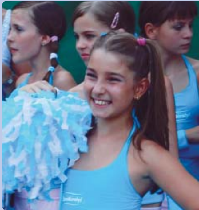
Egymást váltották a táncgyűttek a hétfői ünnepségen. A fiatalok különösen nagy sikert arattak.