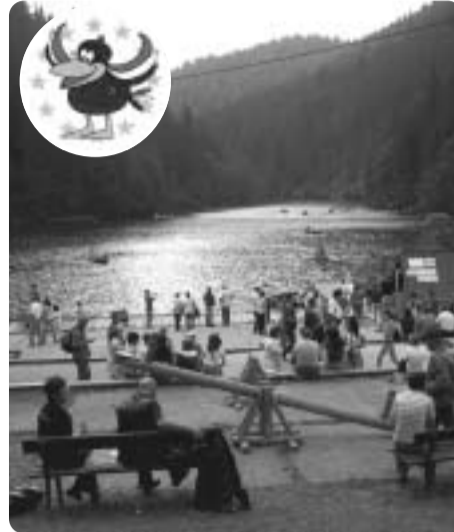
Jól sikerült a kirándulás a Gyilkos-tónál