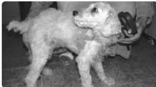
Egy megmentett halálra ítélt kis állat.

kötöttek ki egy kutyát, aminek már folyt a vér a szájából. A kegyetlenkedők várták a vonatot, hogy az végezzen vele, de szerencsére előbb értesítettek minket. A kikerülő ebrendészeket meg akarták késélni, így rend-