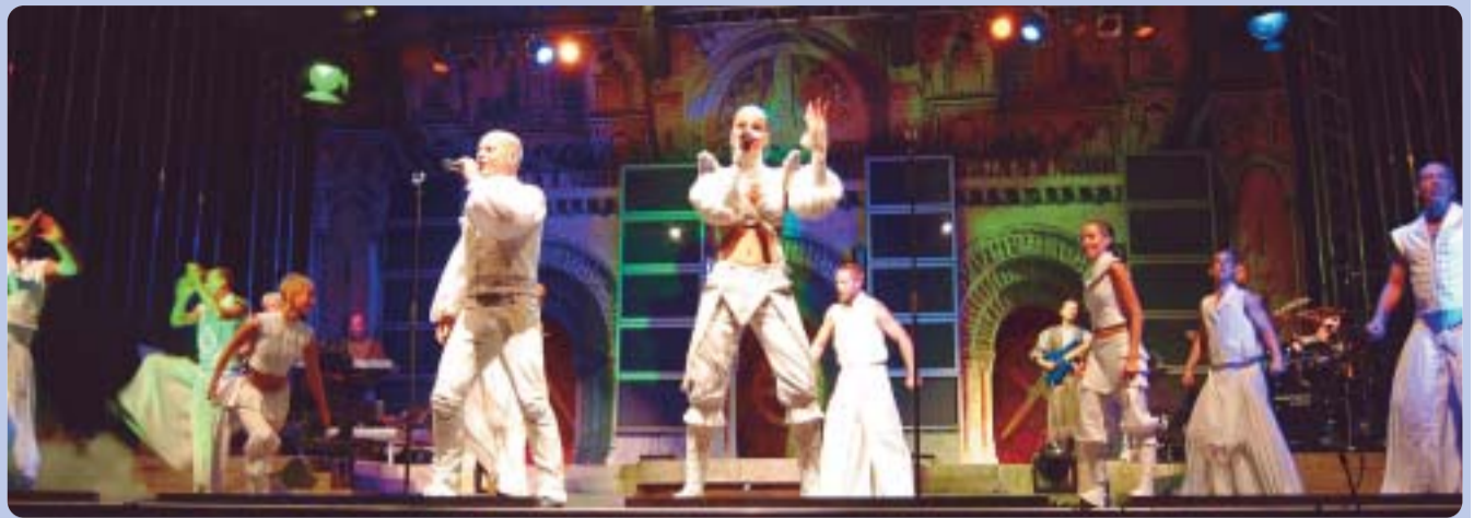
A NOX együttes – mint ahogy azt már megszoktuk a látványos produkciókat bemutató formációtól – remek hangulatú koncertet adott szentkirályi közönségnek is.

Külön fénypontja volt az ünnepségnek, a Szentkirályi Ásványvíz Kft. által meghirdetett, „Minden cseppje aranyat ér!” elnevezésű, nagyszabású promóciós játék eredményhirdetése. Hiszen nem csak milliós értékű bankkártyákat sorsoltak ki szép számmal, hanem egy Mercedes-Benz C-osztályú, szuper személygépkocsit is.