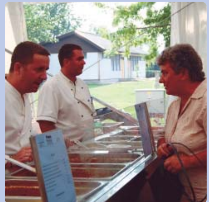
A finom falatokról a Holló Lakodalmos Vendégház gondoskodik augusztus 20-án is.