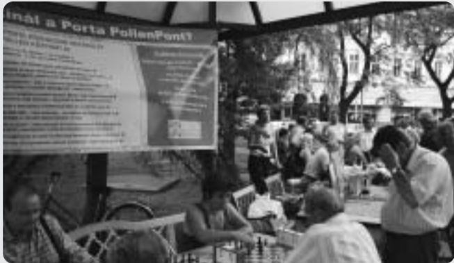
Hévígyi versenyek a Sugár György emlékparkban

Egyértelműen látszik, hogy a Kodály Fesztivál egy szűkebb közönséget érdekel, de ez a rendezvény olyan komoly értéket képvisel, amelyre méltán lehet büszke városunk. Így mindenképp folytatni, öregbíteni kell a fesztivál hagyományát. Míg a közösségi, szórakoztató programokon elsősorban kecskeméti és a környező településekről érkező vendégek vesznek részt, addig a Kodály Fesztivál rendezvényeire nagyon sok külföldi utazik városunkba. Arra kell törekednünk, hogy minden évben megteremtsük a tökéletes arányt, összhangot a környezethez és a rétegigényt kiszolgáló programok között, így mindenki megtalálhassa számításait a híres városban. Bizonyosodott, hogy a fesztiváli programok nagy közönséget vonzanak, bátran lehet építeni ezekre. Ha pedig tovább finomítjuk, erősítjük ezt a vonalat, akkor a kulturális idegenforgalom akár húzóágazata is lehet a városnak.