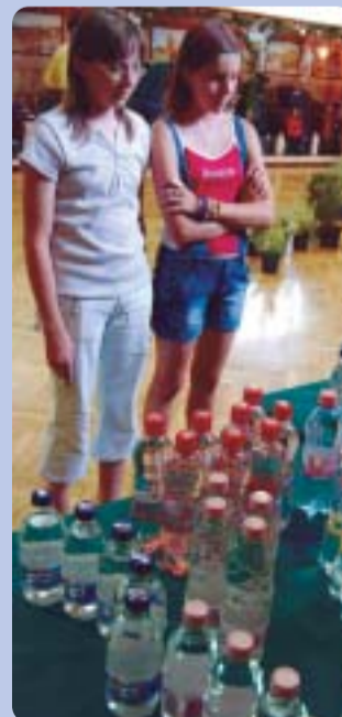
Köszömlén a Szentkirályi Ásványvíz Kft. termékei.