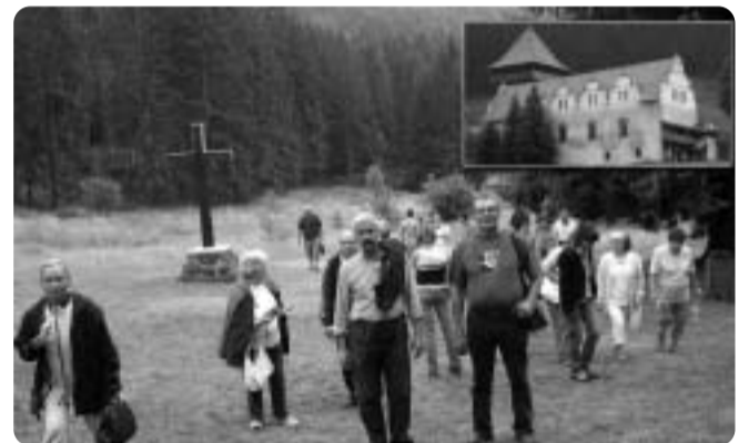
Vendéglátóink kitűnő túrákat szerveztek és feledhetetlen élményekkel gazdagodva tértünk haza.

Szinte észre sem vettük és máris elérkezett a búcsúeste.