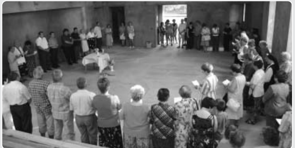
Az első Szent Ferenc ünnep, a Porcinkula már a lefedett templomban volt.

A kivitelezés, a templomépítés mindannyiunk örömeire szépen halad. De a megközelítőleg nyolcvanmillió forintba kerülő építkezés még nincs befejezve. A teljes summa összegyűjtéséhez még hiányzik tízmillió forint. Az eddigi tapasztalatok alapján azonban a templomalapítók bizakodóak. Tudják: lesznek még segítők, önkéntes adományozók, összegjön a szükséges pénz, és a tervezett időre állni fog a Szent Ferenc kápolna.