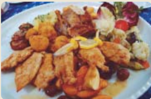
Gasztronómiai és esztétikai élmény a frissensültekkel teli tál.